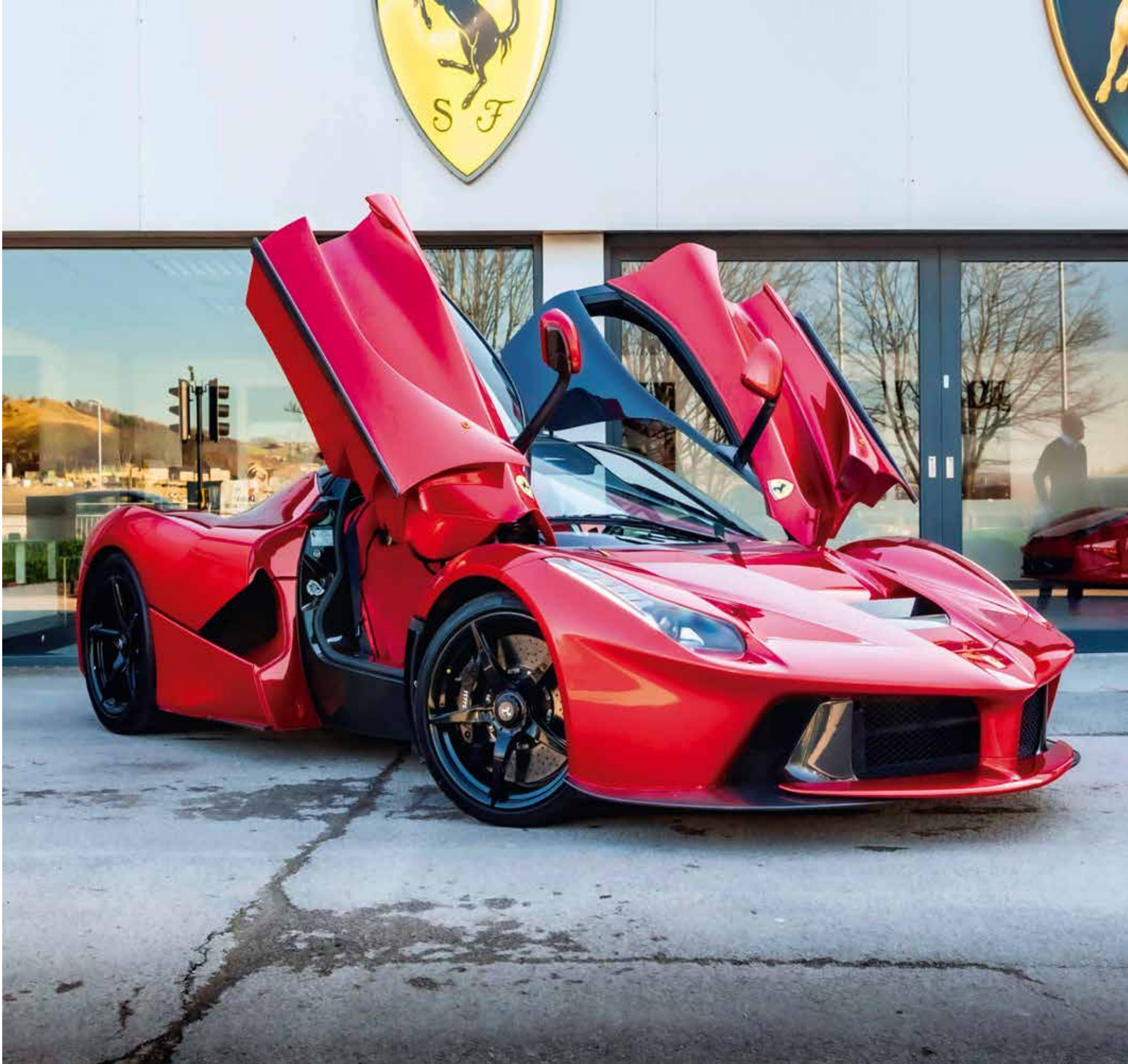
A 5588 - FERRARI