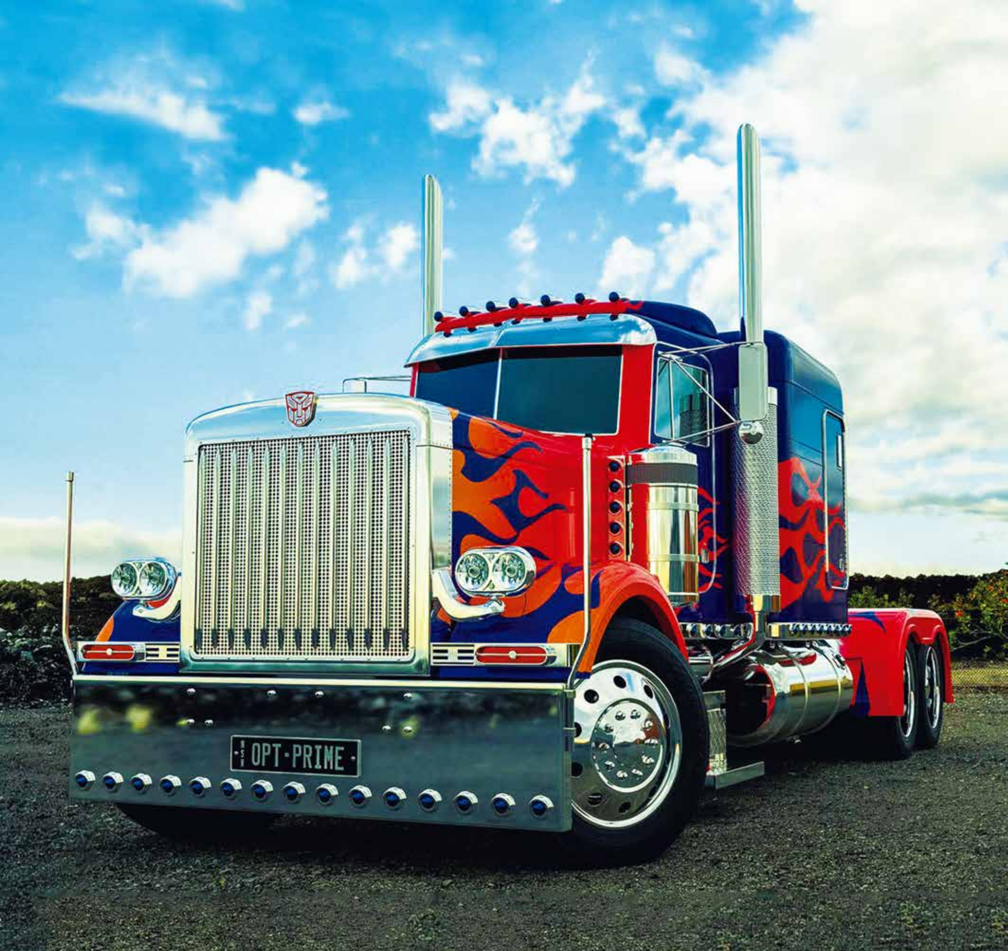
A 5592 - MI JOYITA