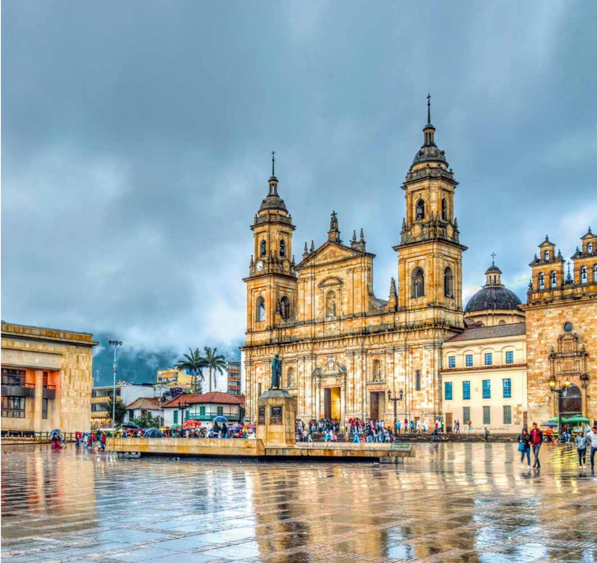
A 5608 - BOGOTA, COLOMBIA