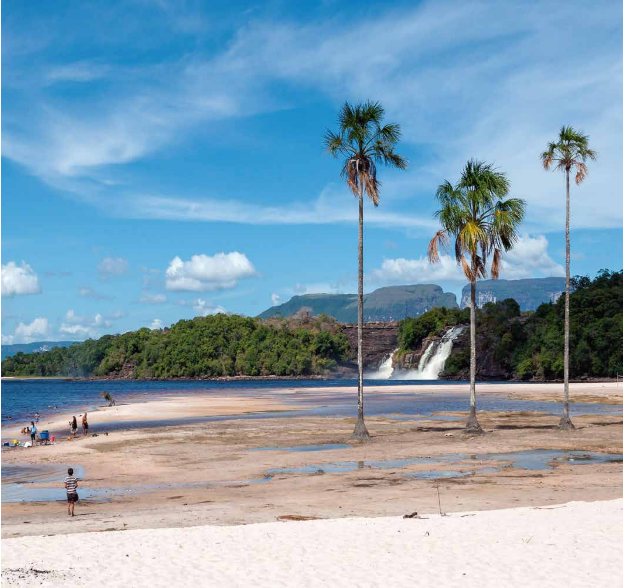
A 5603 - LAGO CANAIMA VENEZUELA