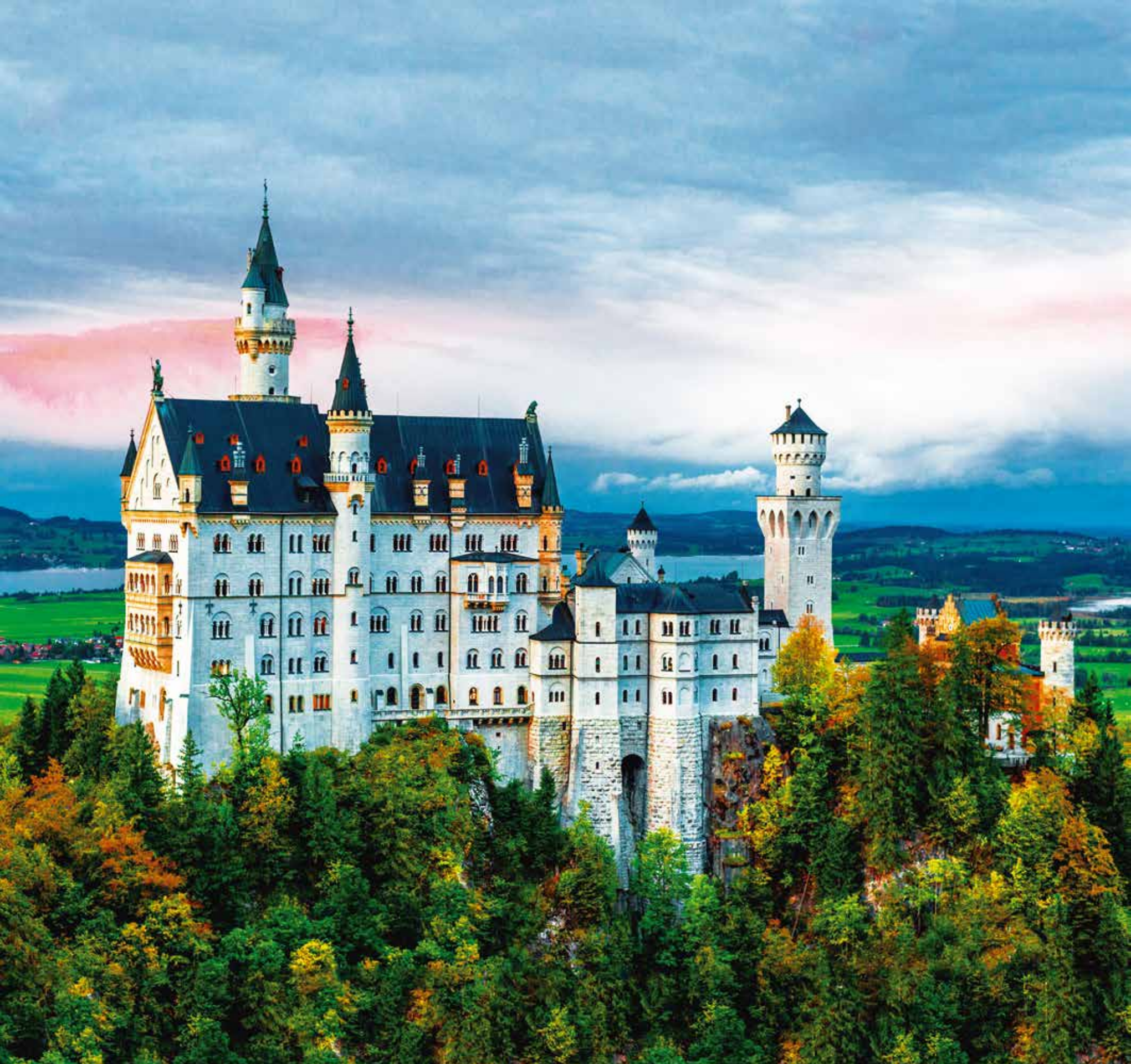
A 5611 - CASTILLO NEUSCHWANSTEIN ALEMANIA