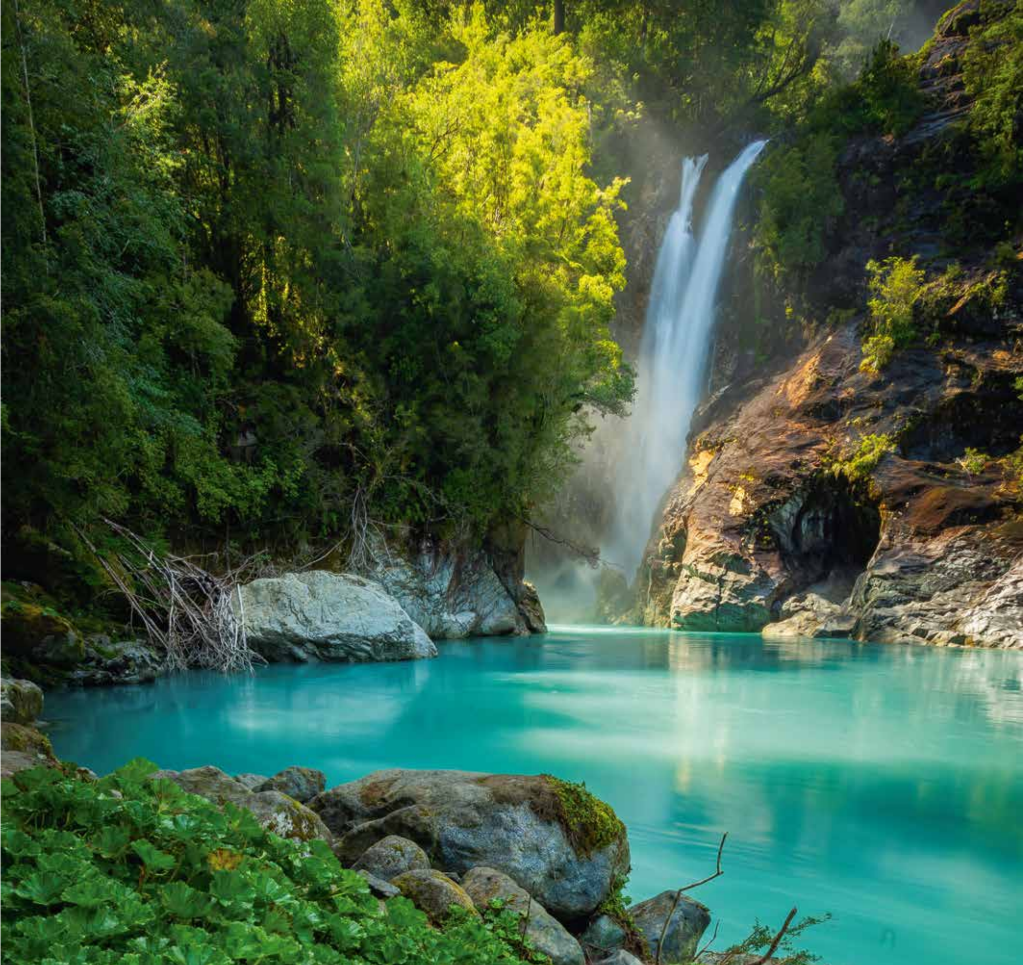
A 5553 - CASCADA RIO BLANCO, HORNOPIREN - X REGION