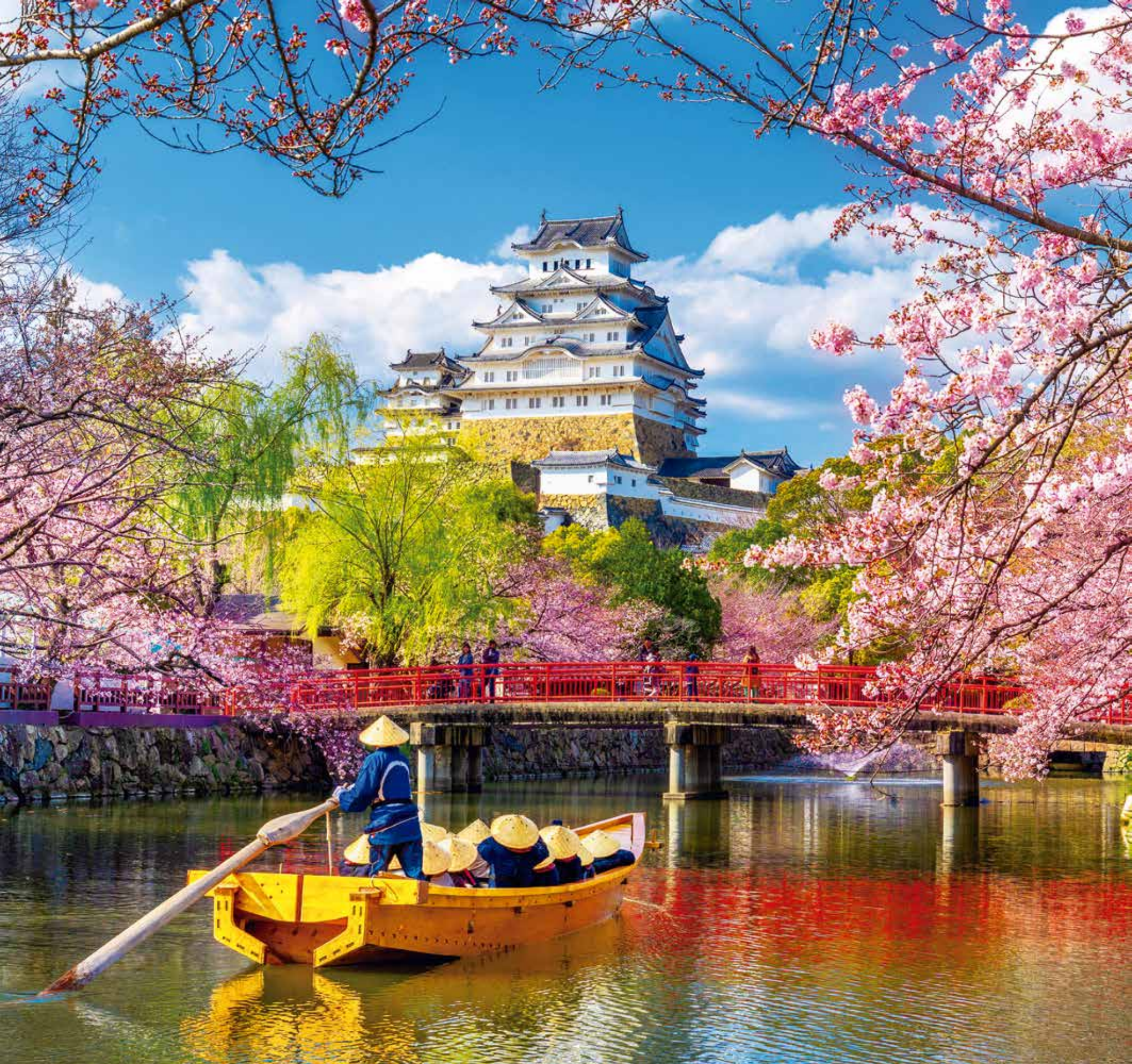
A 5613 - CASTILLO HIMEJI, JAPON