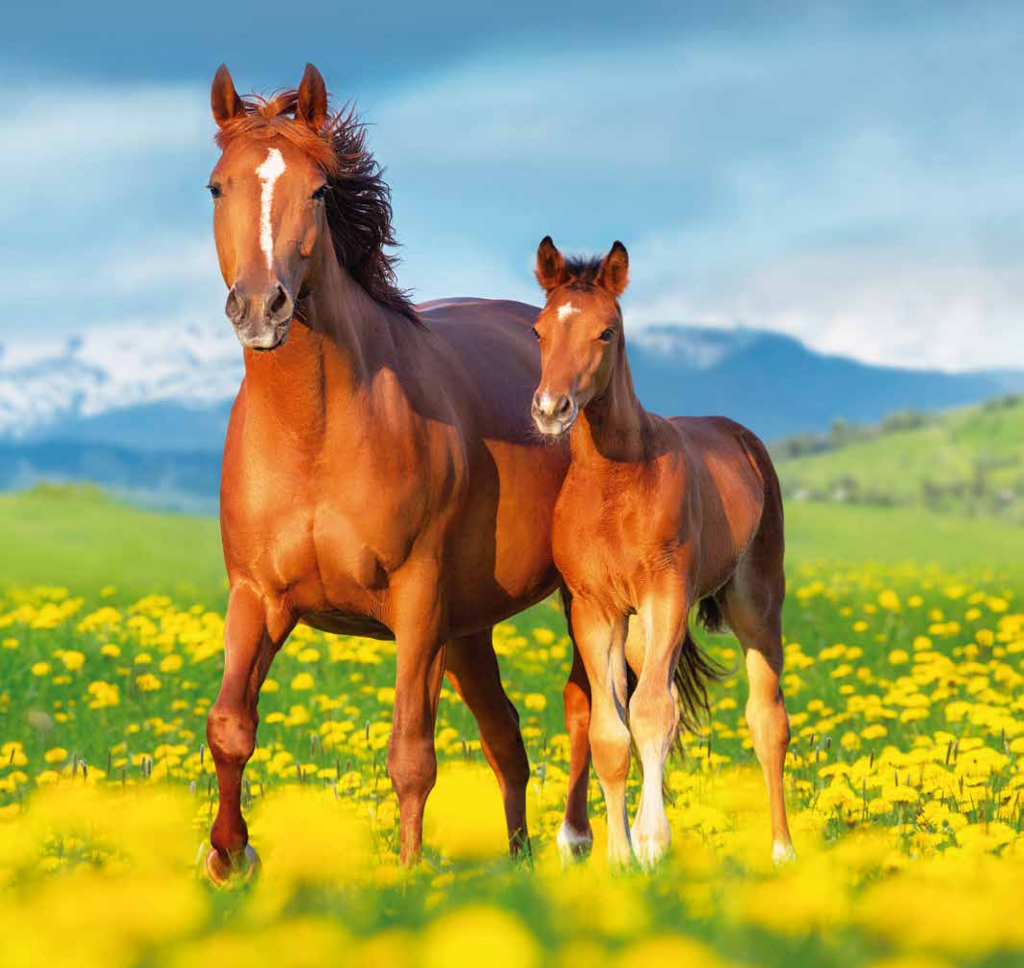
A 5571 - YEGUA Y SU POTRO