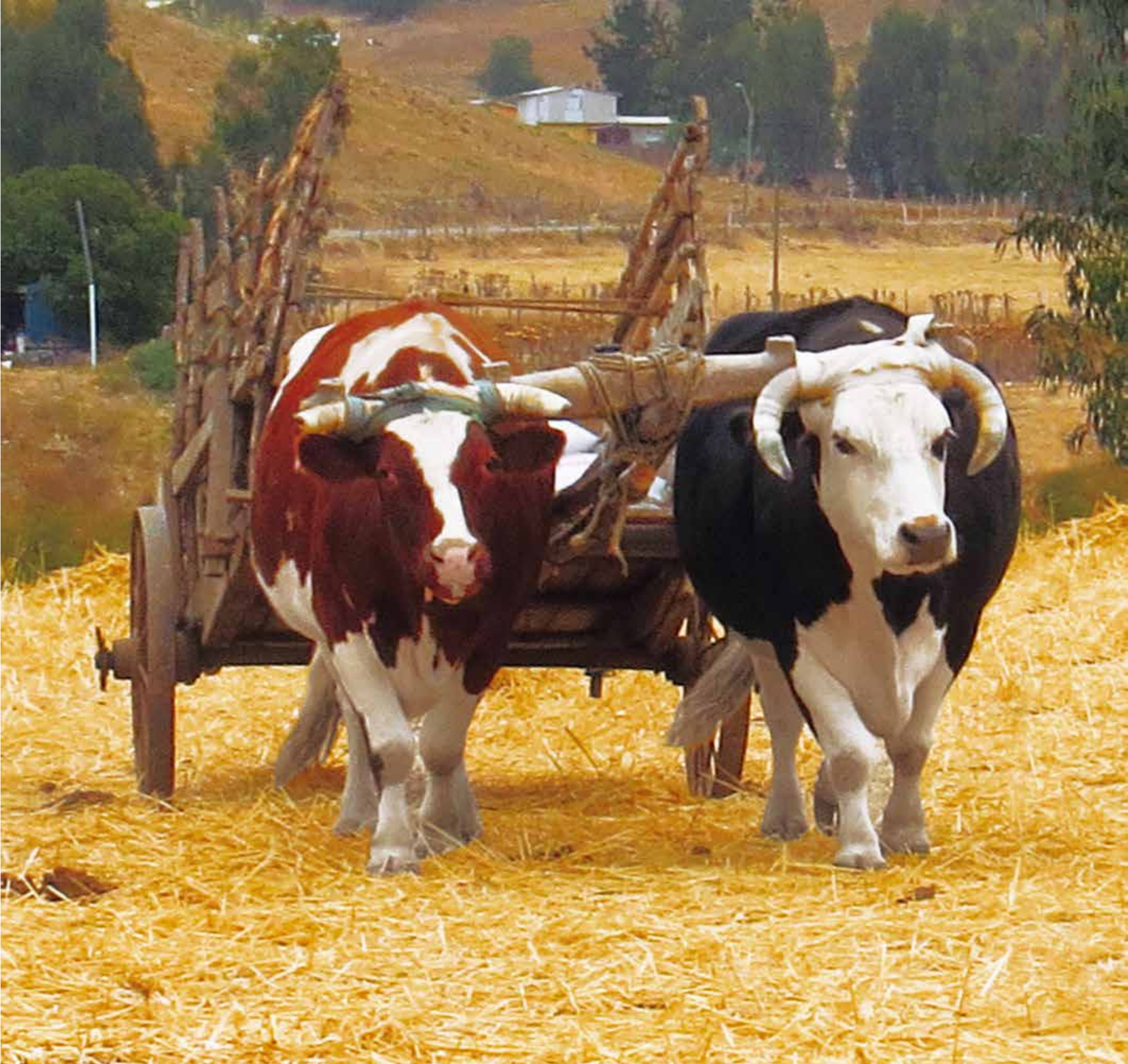
A 5559 - YUNTA DE BUEYES