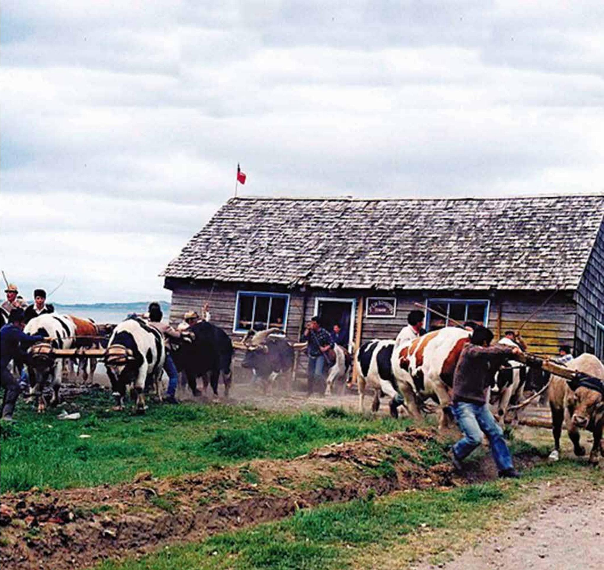
A 5549 - MINGA, CHILOE X REGION