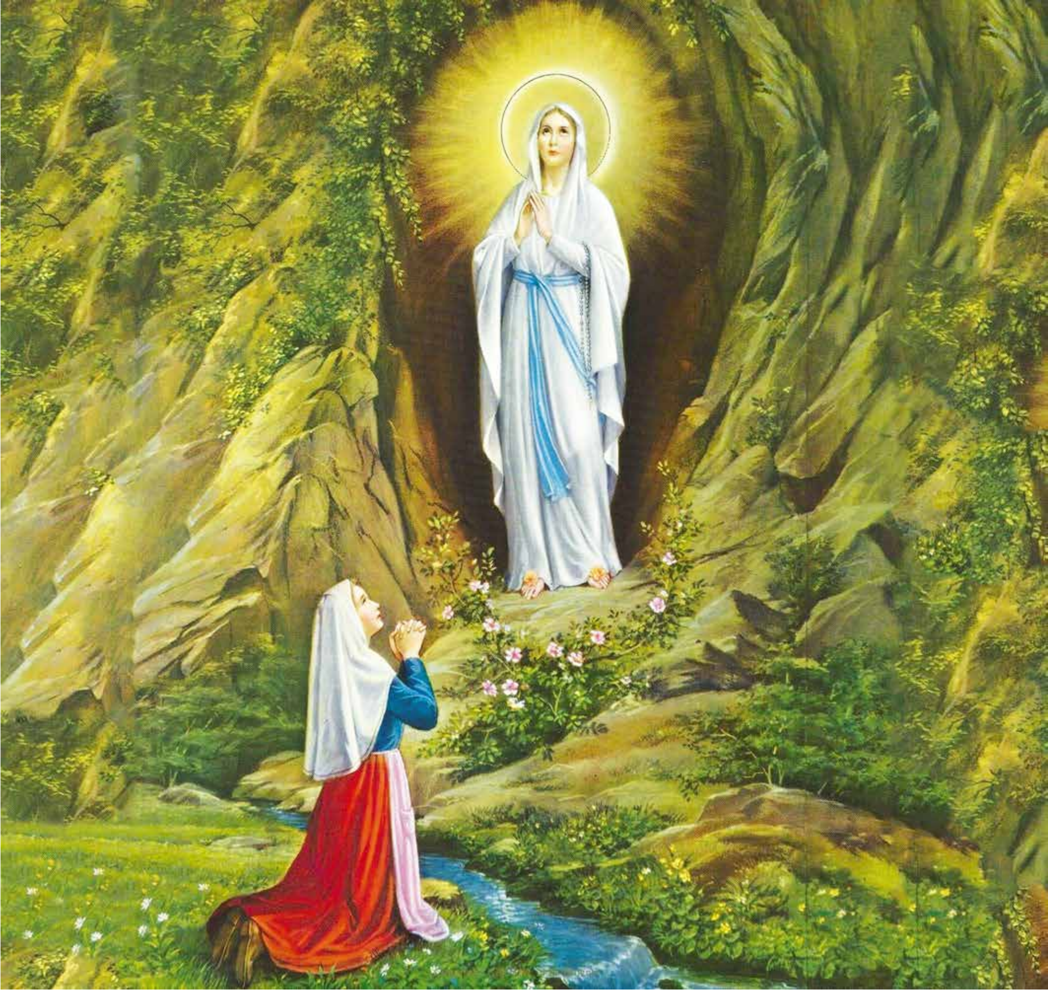
A 5072 - VIRGEN DE LOURDES