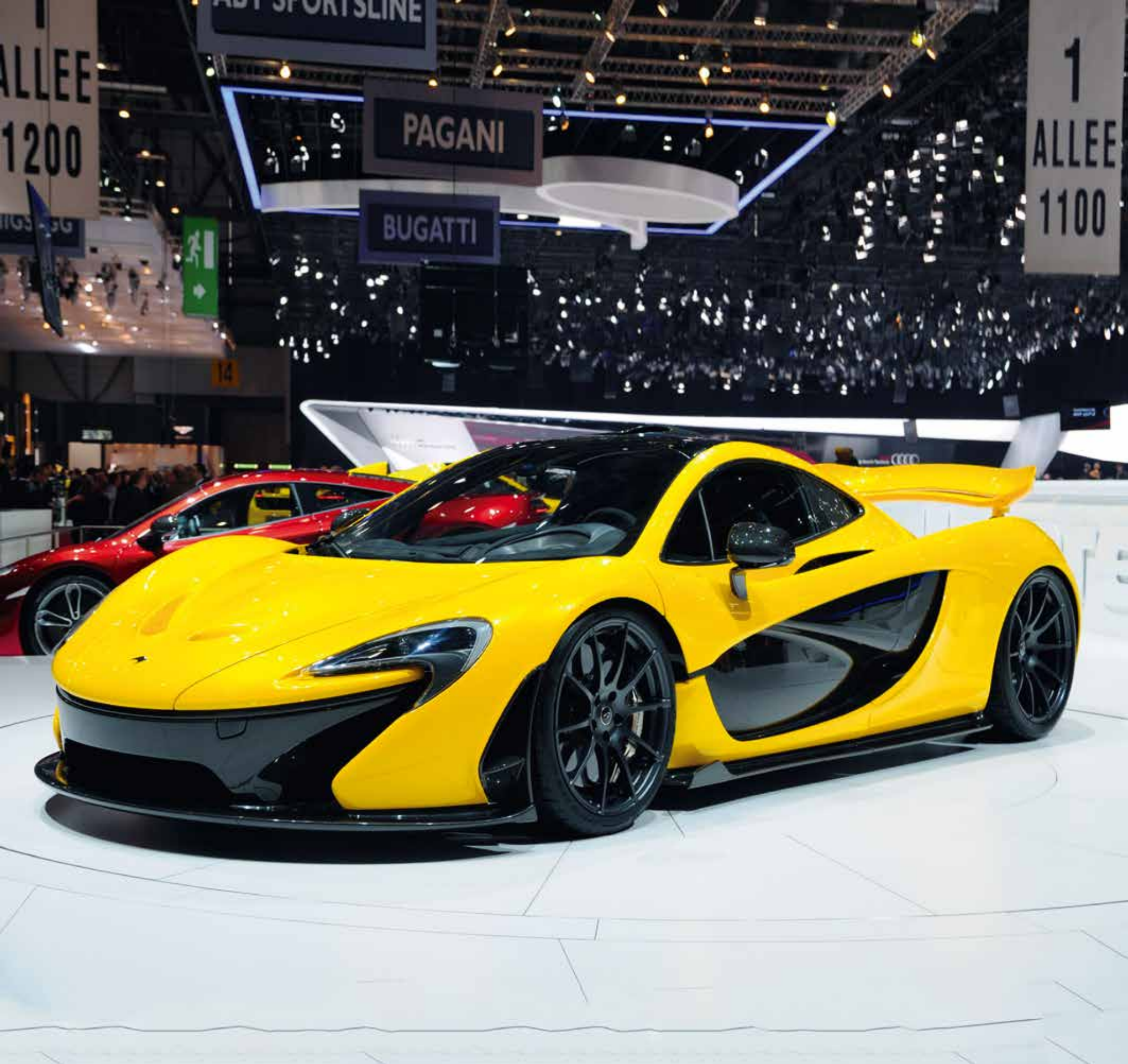
A 5587 - MCLAREN