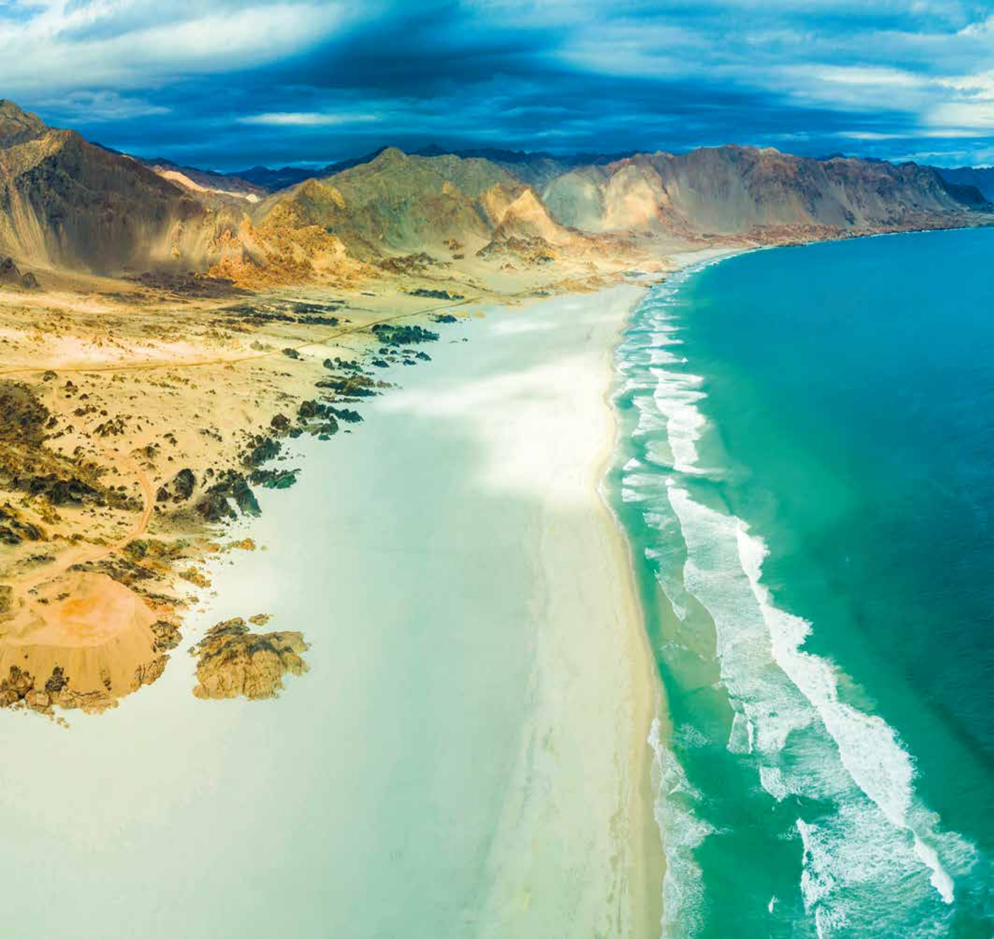
A 5513 - PLAYA BLANCA, CALDERA III REGION