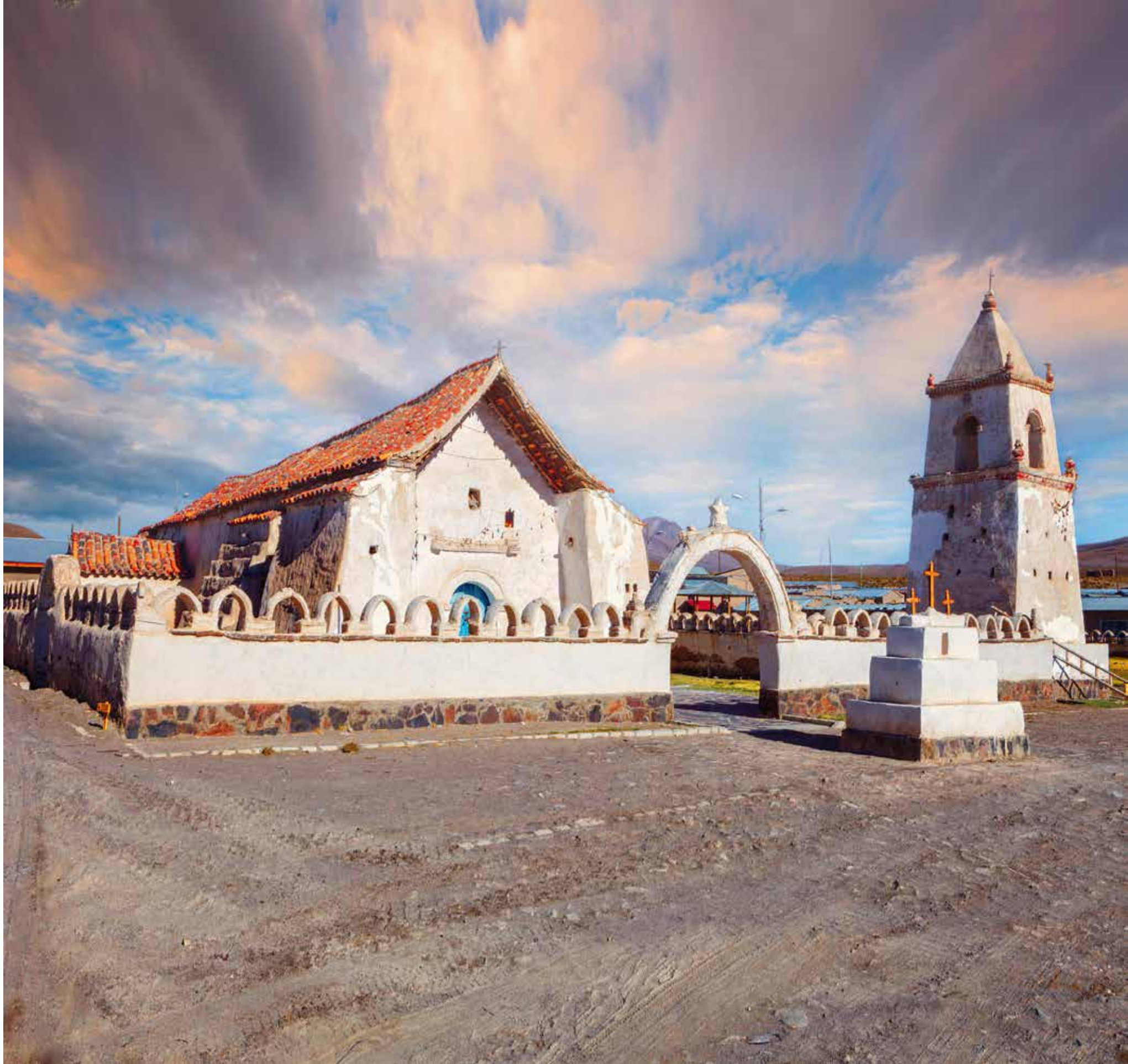
A 5504 - COLCHANE I REGION