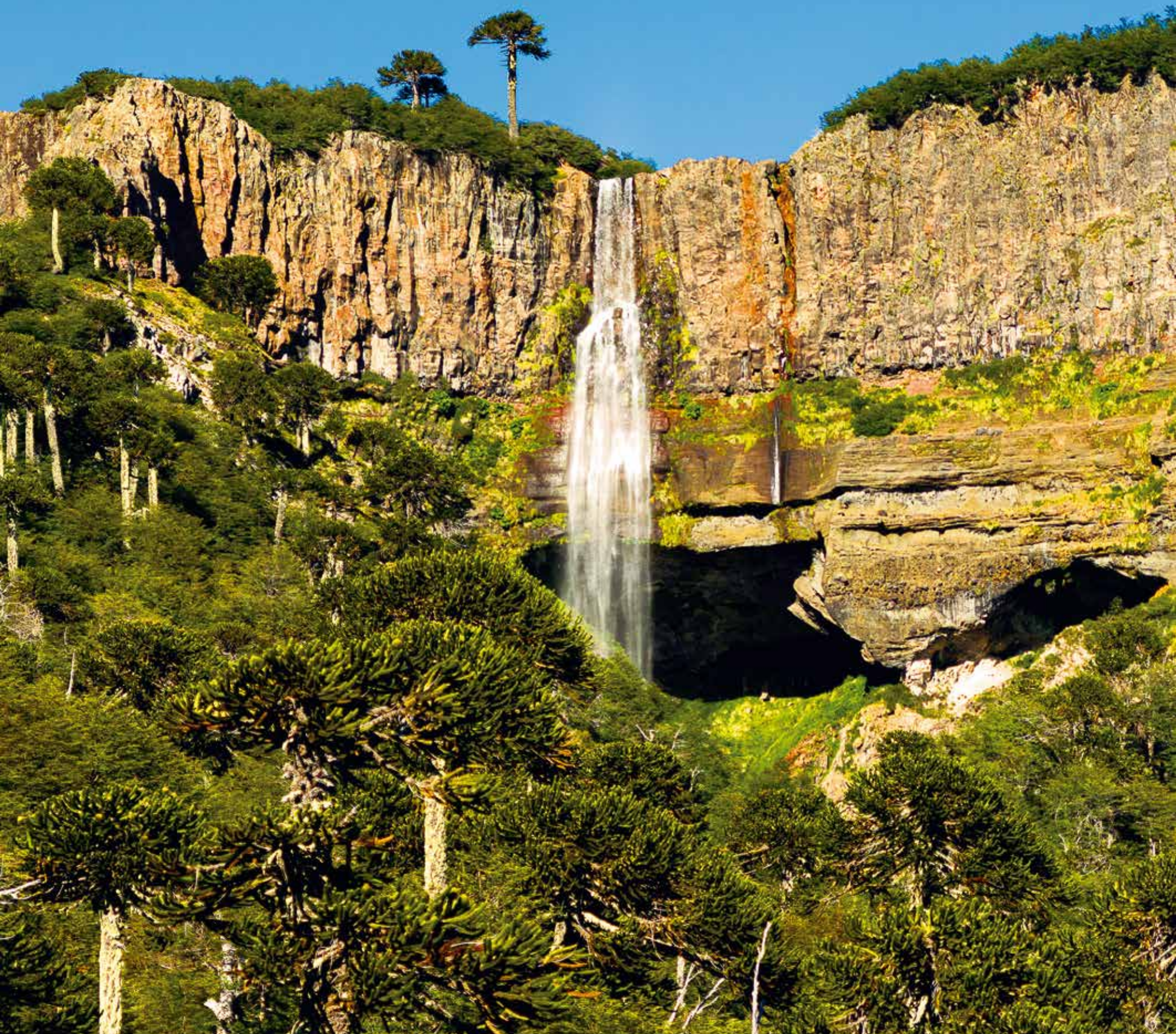
A 5538 - SALTO PUNTA NEGRA ARAUCANIA - IX REGION