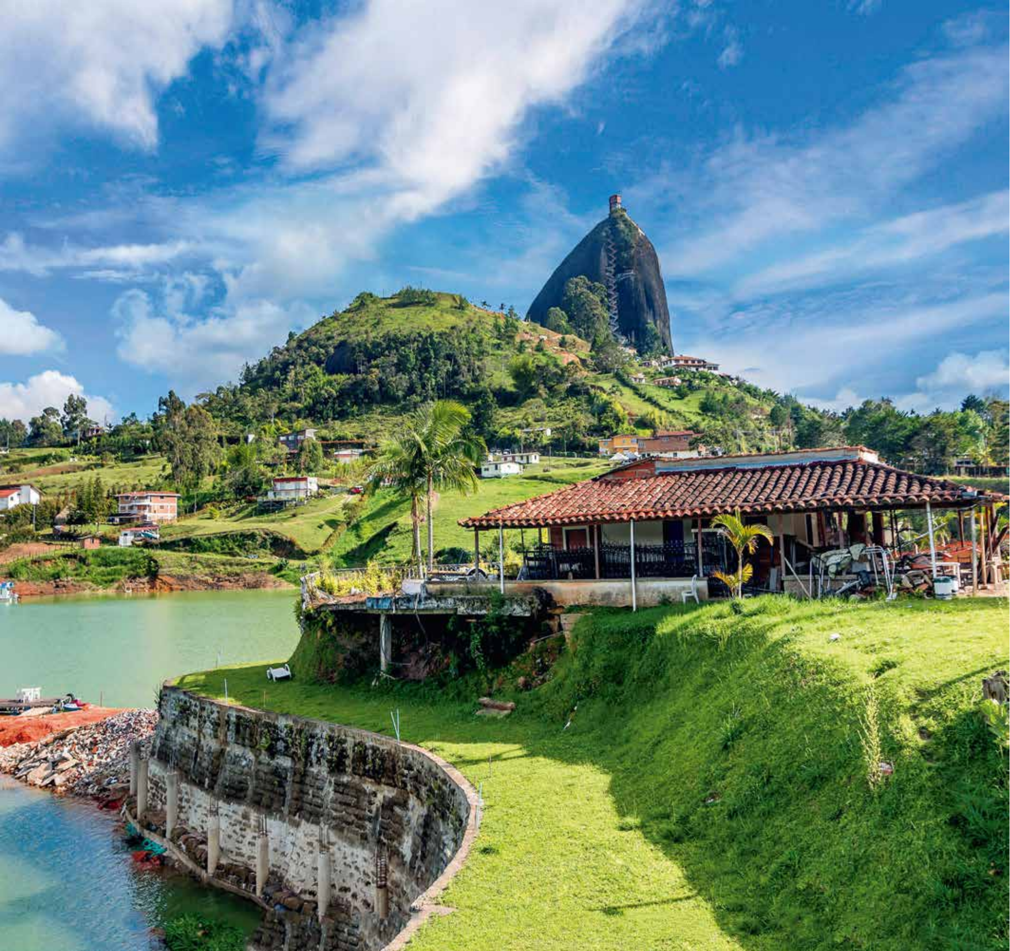
A 5606 - ROCA DE GUATAPE COLOMBIA