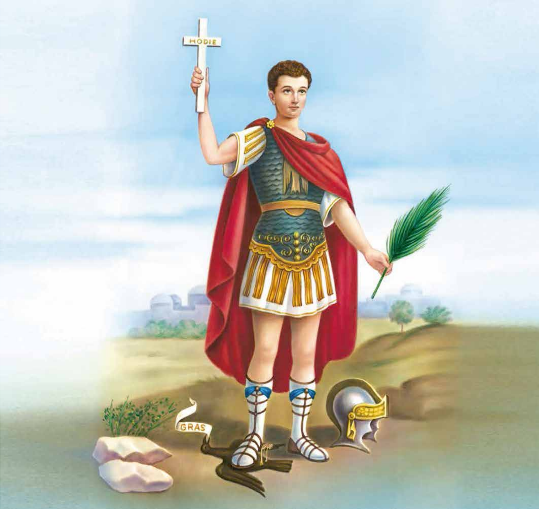
A 5070 - SAN EXPEDITO