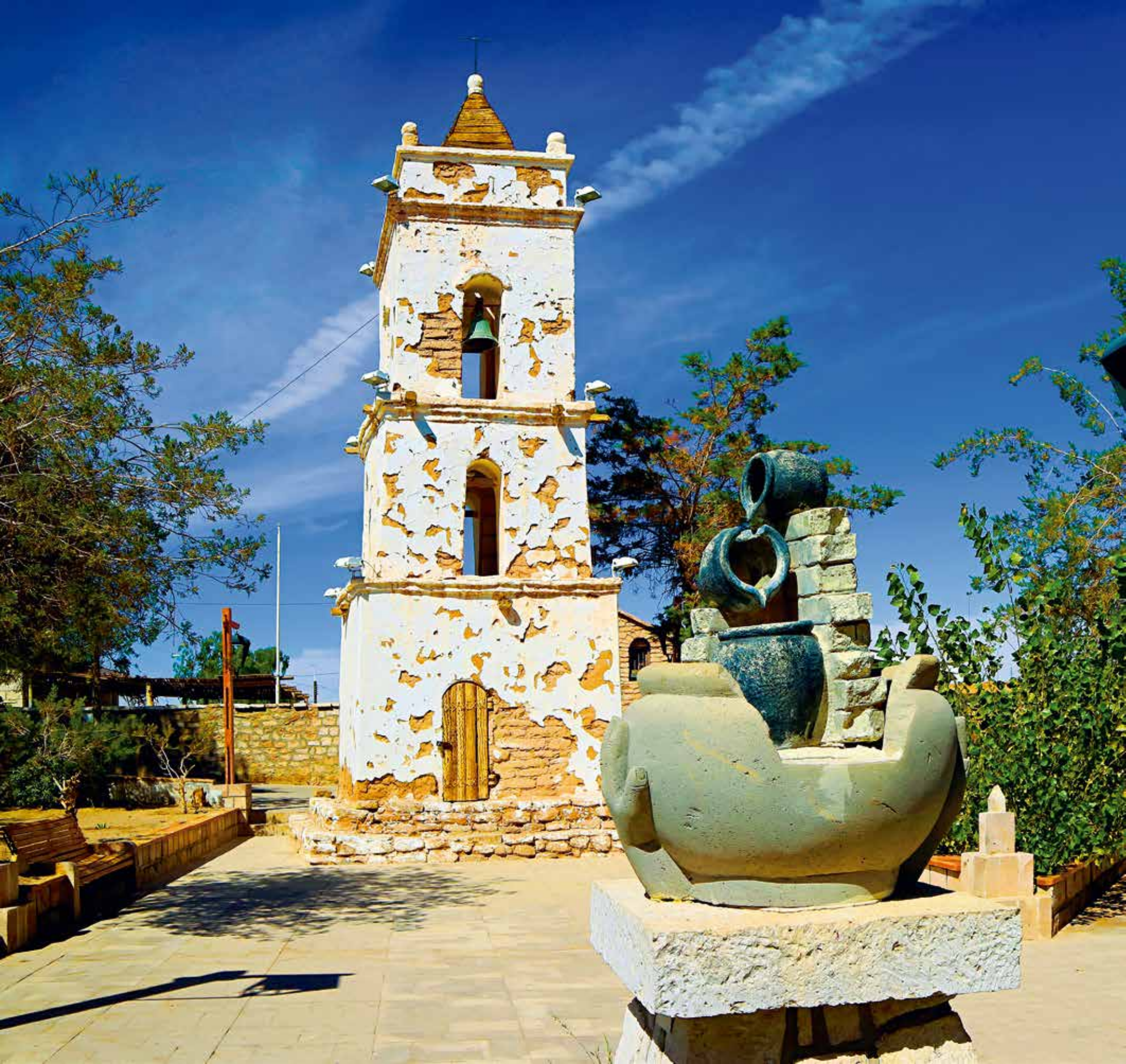
A 5509 - TOCONAO II REGION