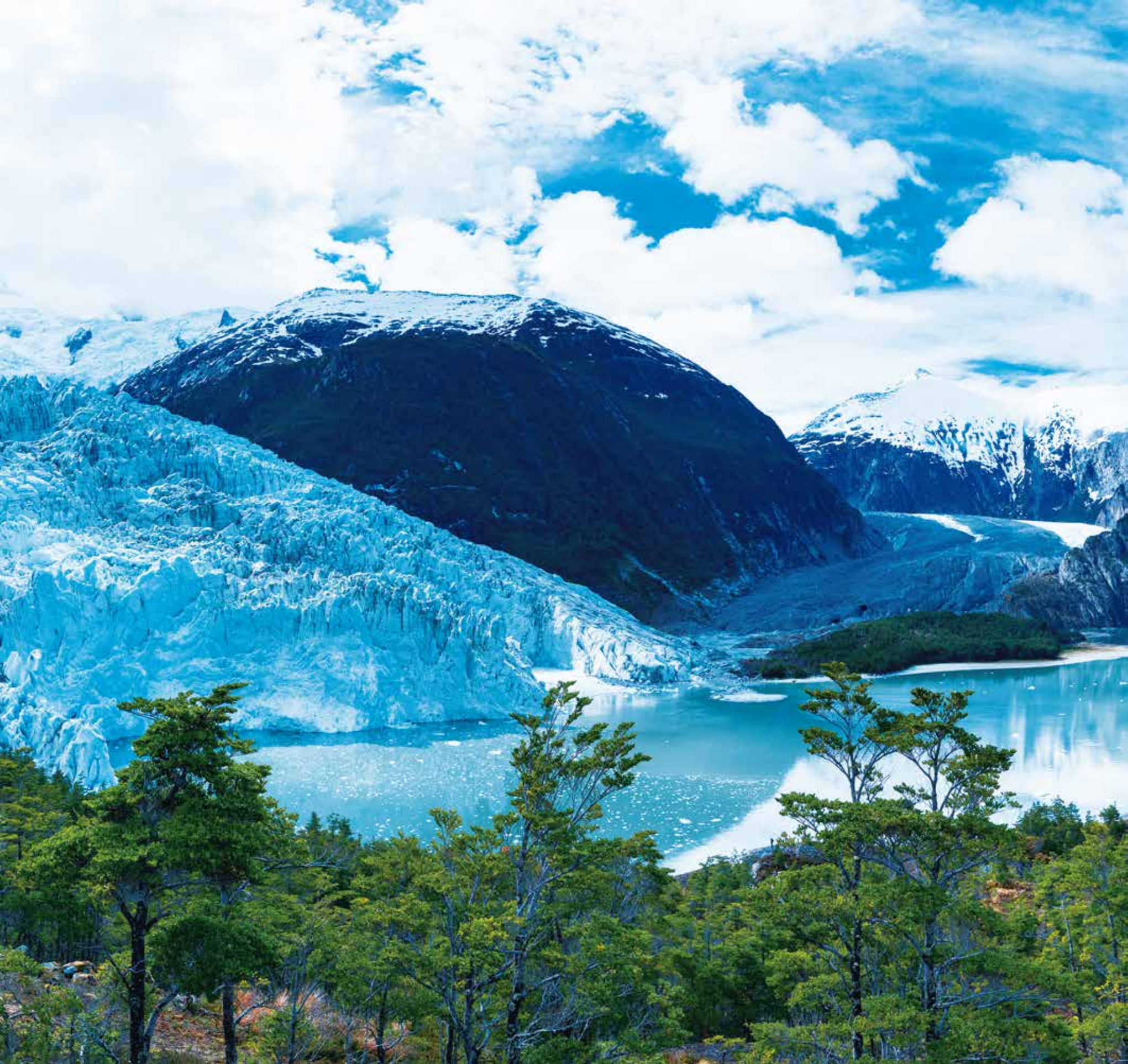
A 5556 - GLACIAR PIA, MAGALLANES XII REGION