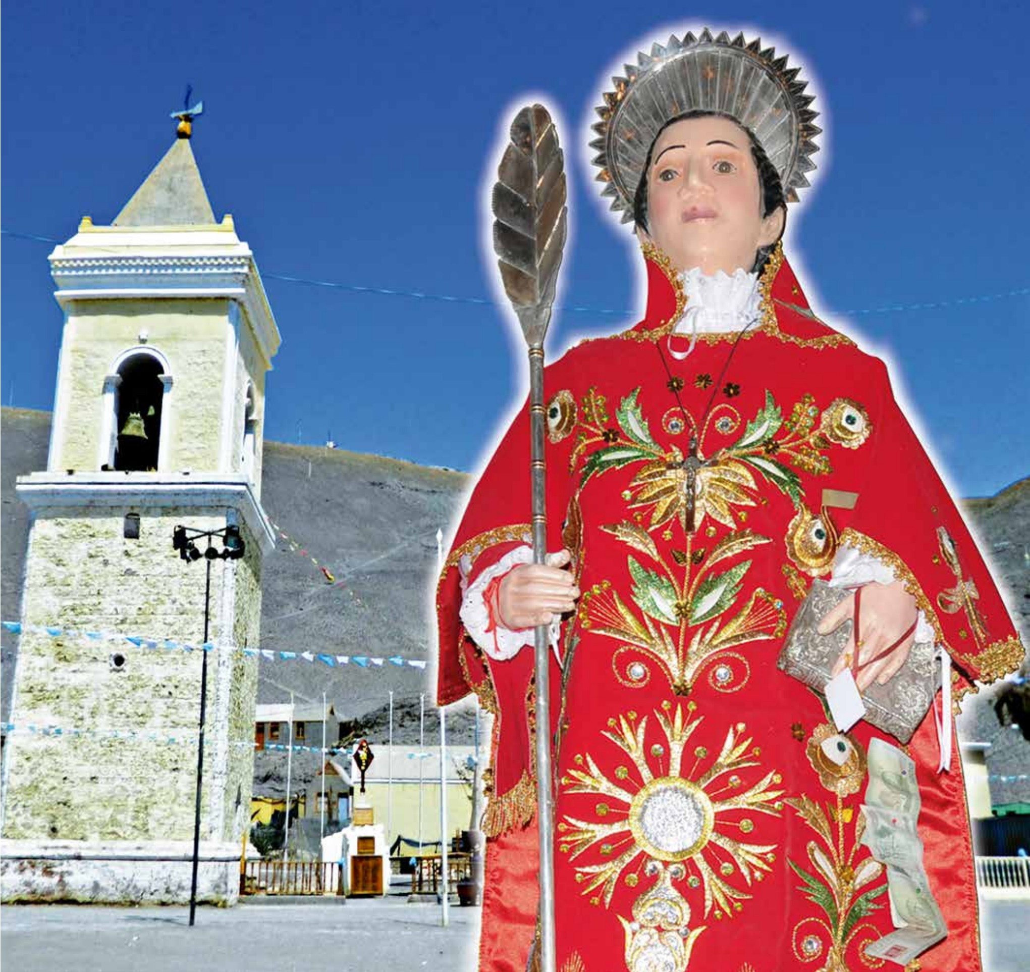
A 5071 - SAN LORENZO DE TARAPACA