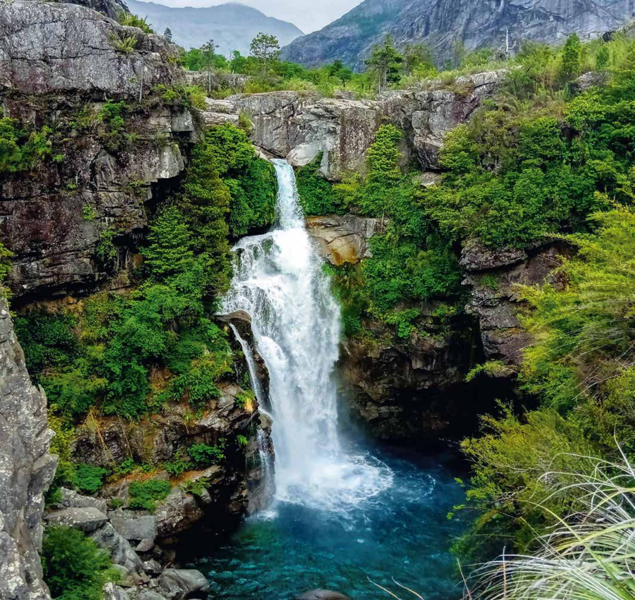
A 5528 - CASCADA DE LAS ANIMAS VI REGION