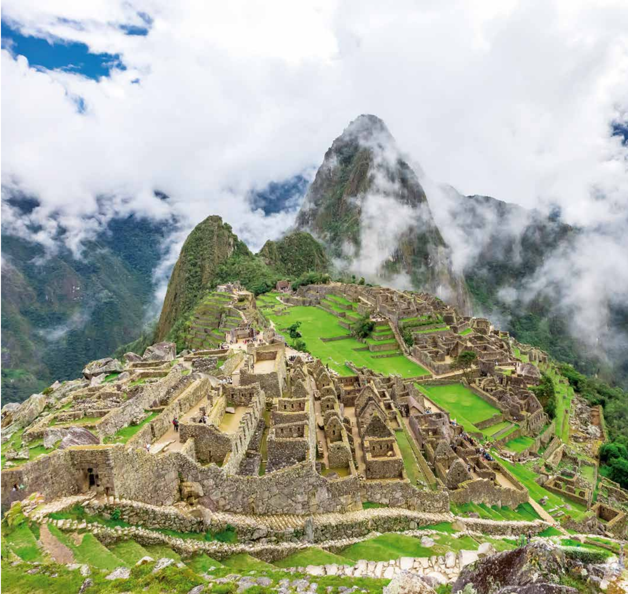
A 5598 - MACHU PICCHU, PERU