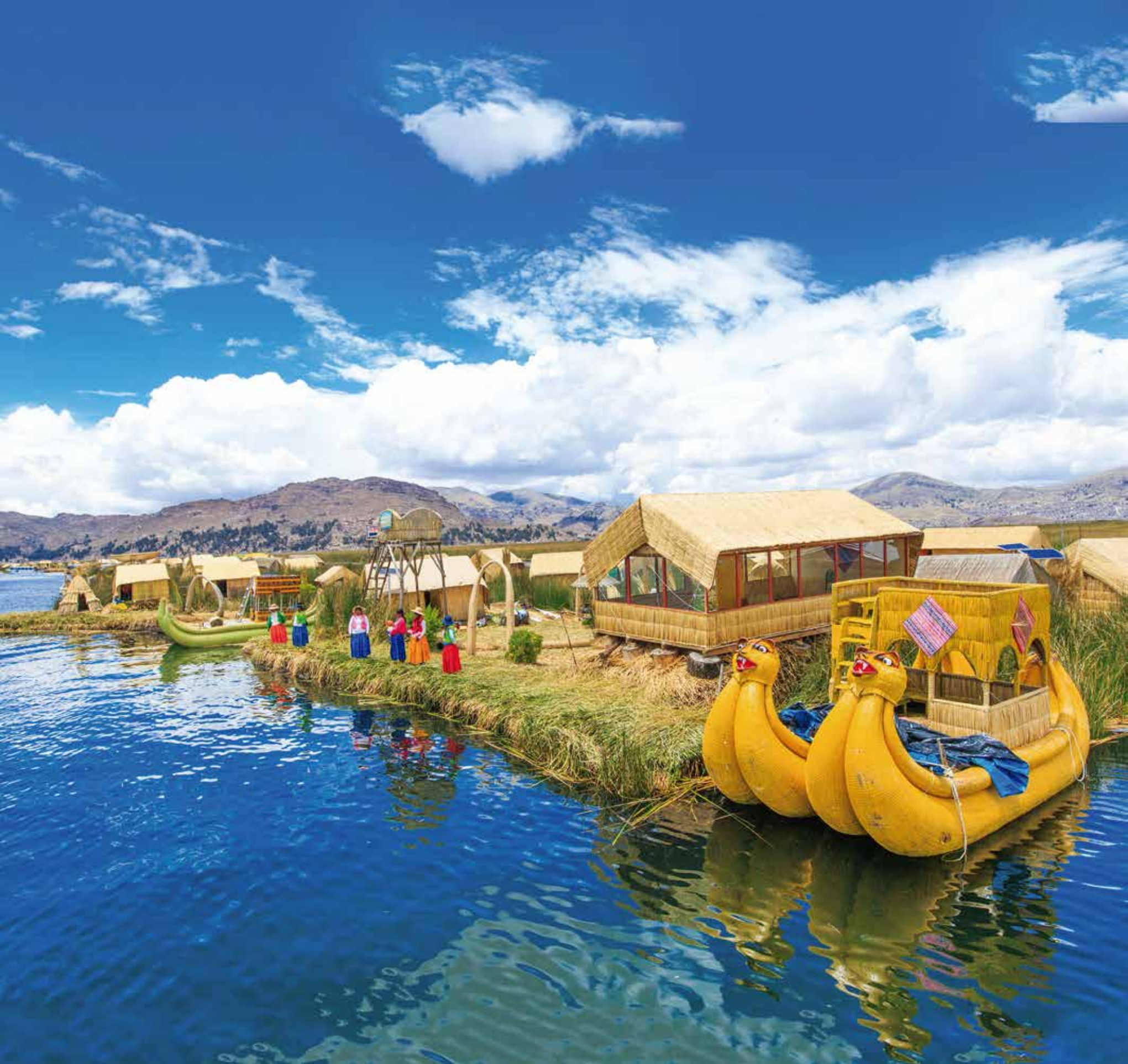
A 5600 - ISLA FLOTANTE DE UROS, LAGO TITICACA, PERU