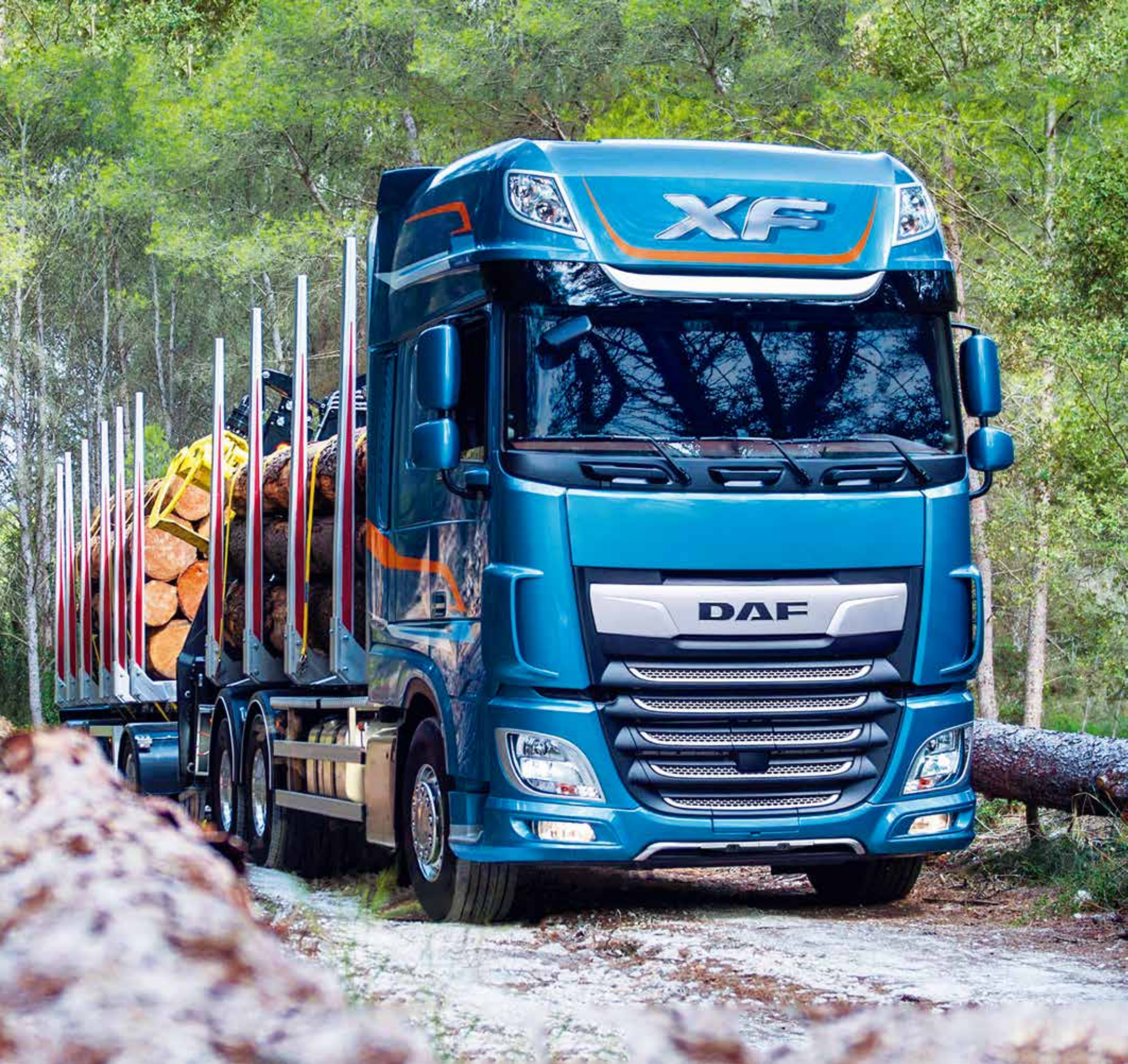
A 5591 - DAF XF