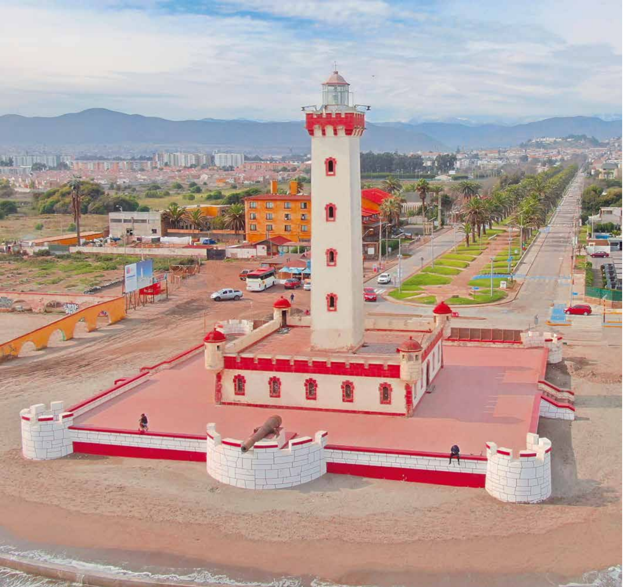
A 5516 - FARO DE LA SERENA IV REGION