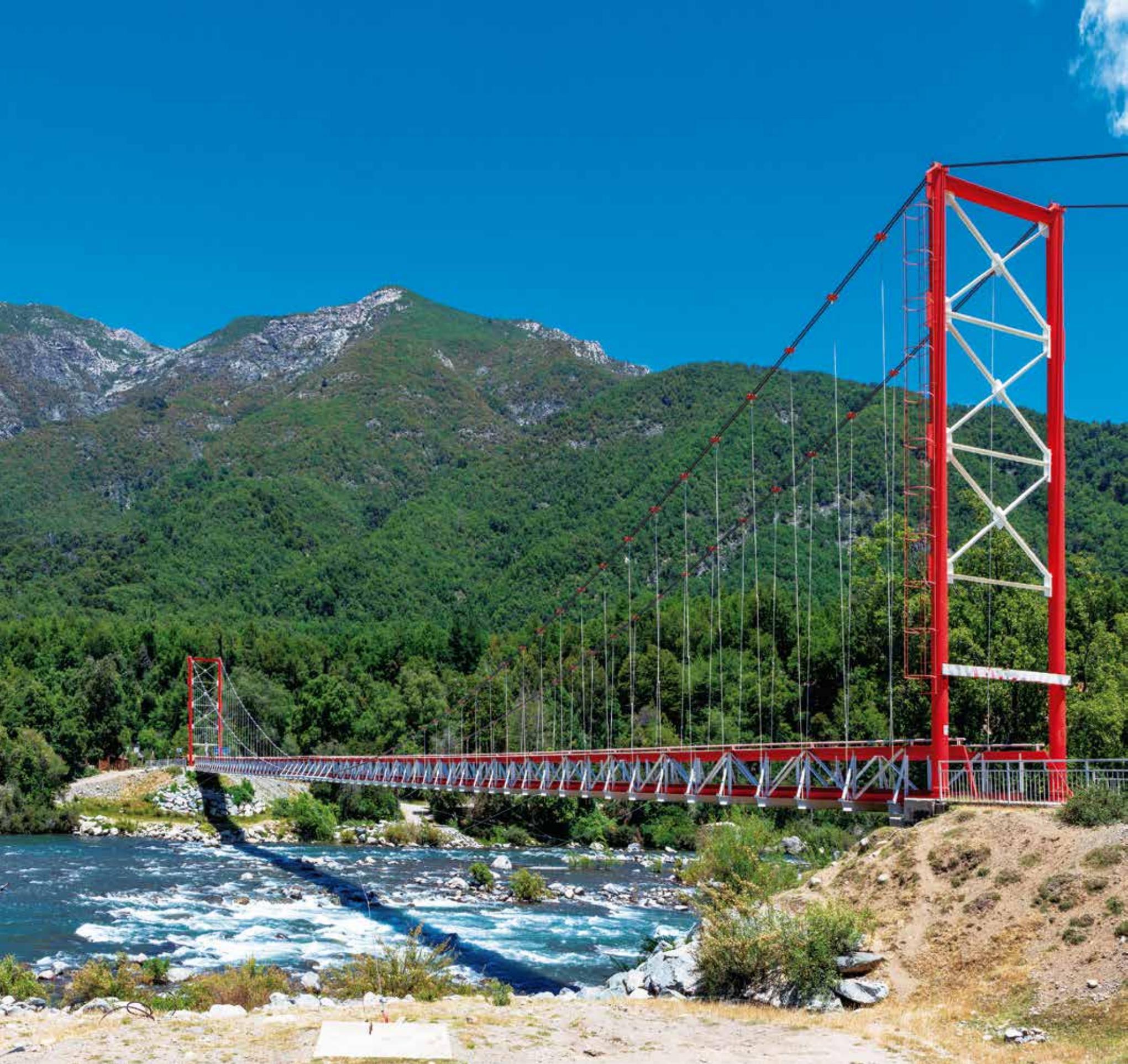
A 5532 - SAN FABIAN DE ALICO XVI REGION