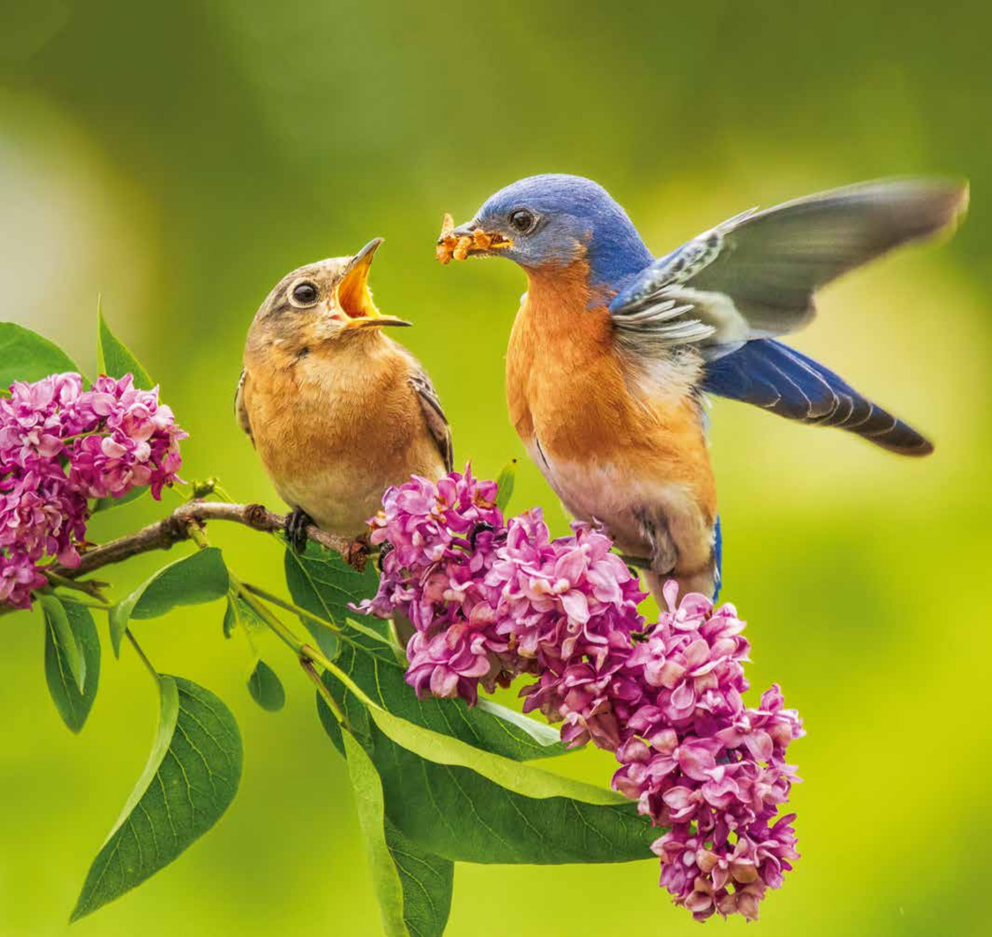
A 5574 - PAJARO AZUL DEL ESTE