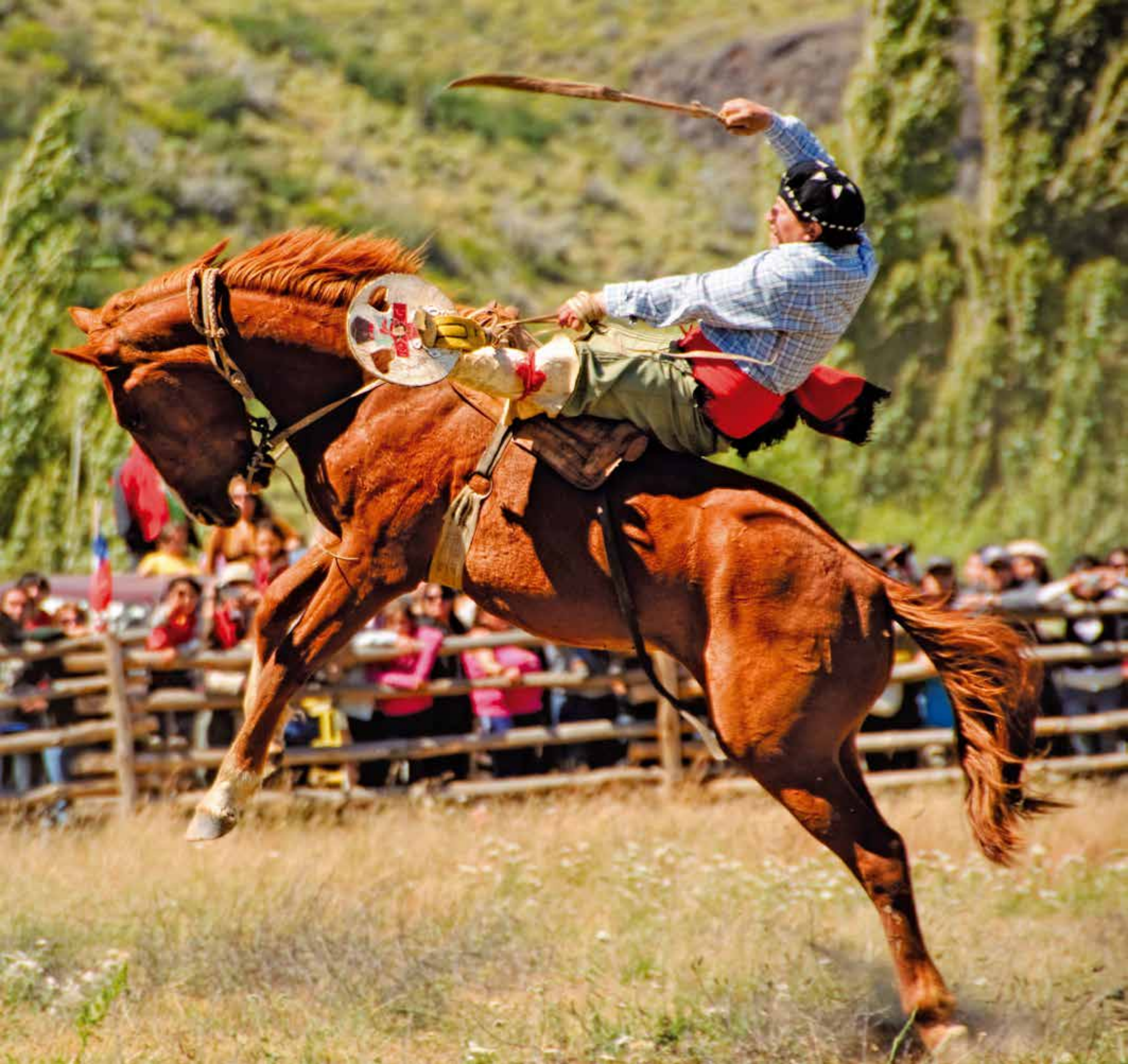
A 5558 - JINETEADA